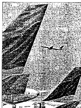
Aviones de Delta.

Tras conocer el posicionamiento de su rival, US Airways reiteró que mantiene